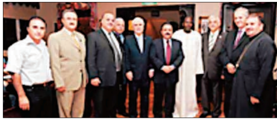
السفراء اميناتي والحيادي وعبد المجيد يتوسطون اعضاء مجلس الرعية.